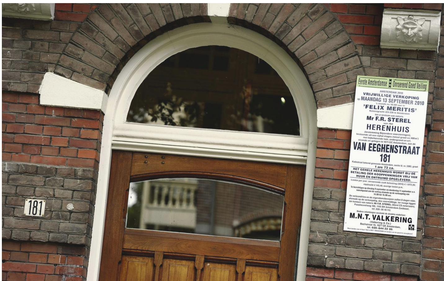
Aankondiging van de executieveiling van een woning in Amsterdam, 2010.